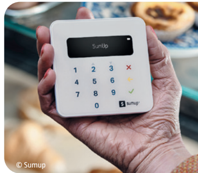
Disposer d'un terminal de paiement facilite les encaissements lors de manifestations.

d'une faible commission à chaque paiement. Au vu du temps gagné, cela vaut vraiment le coup. Nous avons accès en ligne à la liste des opérations et bénéficions d'un virement rapide sur notre compte. » Une bonne idée qui inspirera sans doute d'autres Apel ! ●