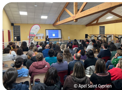
Une conférence apportant des réponses concrètes aux questions des parents.