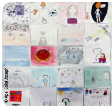
Réalisations des enfants en cours de dessins exposées en salle d'étude.