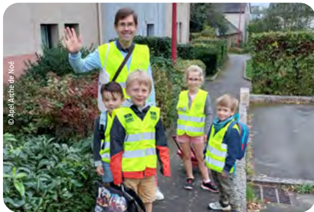
Enfants de l'école Arche de Noé et leur « conducteur » arrivant à l'école.

Une ligne de pédibus desservant l'école privée et l'école publique de la commune est née du partenariat entre l'Apel Arche de Noé et la mairie.